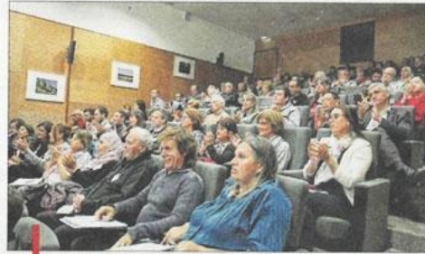
Le conseil citoyen doit donner aux habitants la possibilité de s'exprimer sur les dossiers de leur quartier.

Après Villiers-le-Bel, Mulhouse, Vienne, c'est au tour d'Avignon et du Pontet d'installer son conseil citoyen.